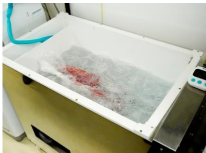
お風呂のような「リジョイス」