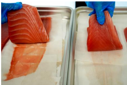
自然解凍例（左） 「リジョイス」で解凍例（右） ドリップの量・発色が違います！